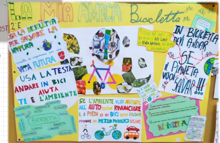
Modena A.S. 2020/2021

Lavori di gruppo interdisciplinari sul tema della mobilità sostenibile