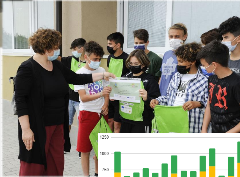
Soliera A.S. 2020/2021