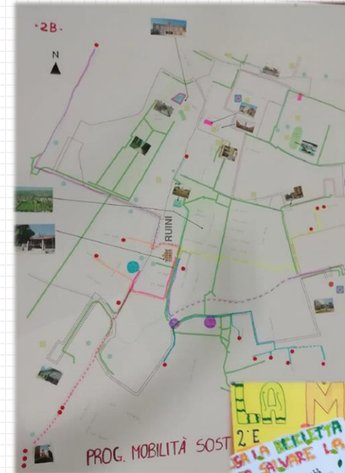
Sassuolo A.S. 2018/2019

Lavori di gruppo interdisciplinari sul tema della mobilità sostenibile